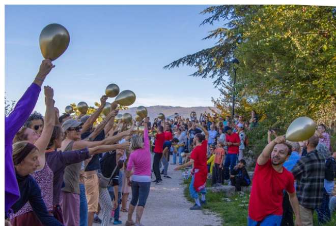
La chorégraphie dans les rues menée par la compagnie Kafig et le final au pied du rocher.