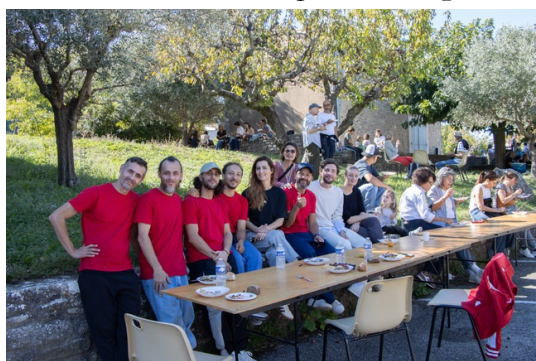
Toute l'équipe de la journée au moment du pique-nique.